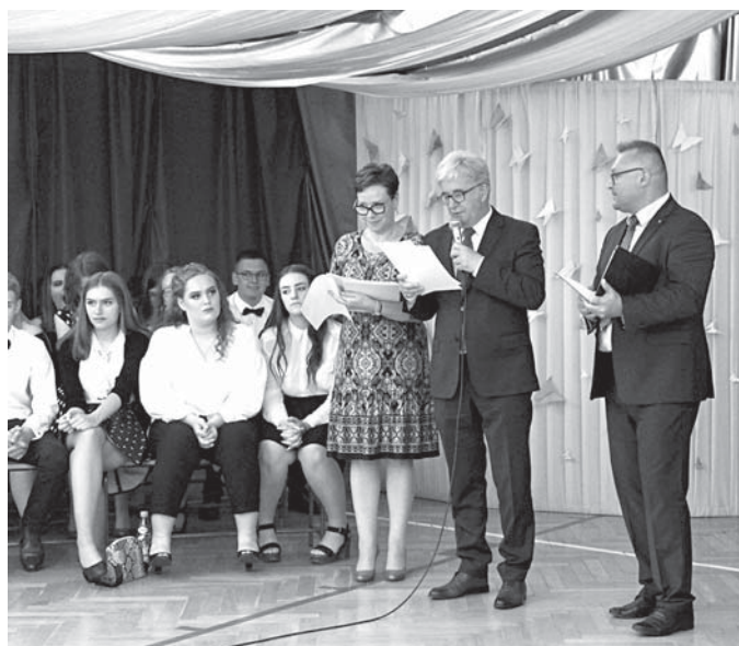
Na zdjęciu: wręczenie stypendiów uczniom w Bydlinie

Którzy uczniowie otrzymali stypendia za bardzo dobre wyniki w nauce i osiągnięcia edukacyjne? Zobacz na stronie internetowej www.gmina-klucze.pl