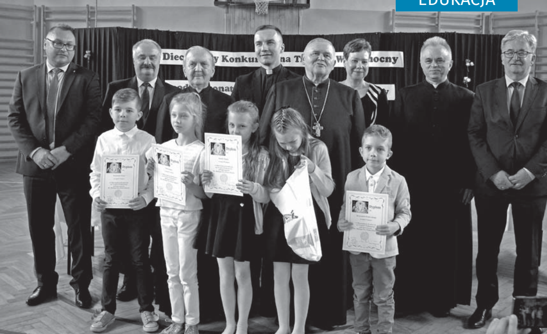
Goście i patroni konkursu z uczniami – laureatami najmłodszej kategorii wiekowej.