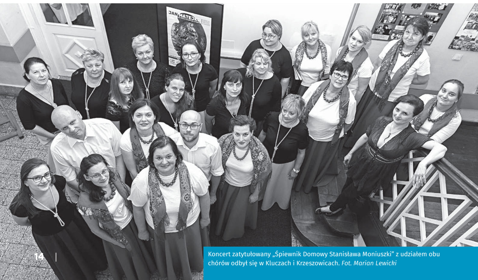
Koncert zatytułowany „Śpiewnik Domowy Stanisława Moniuszki” z udziałem obu chórów odbył się w Kluczach i Krzeszowicach.