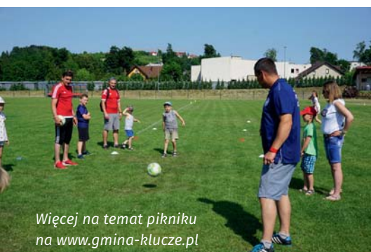
Więcej na temat pikniku na www.gmina-klucze.pl