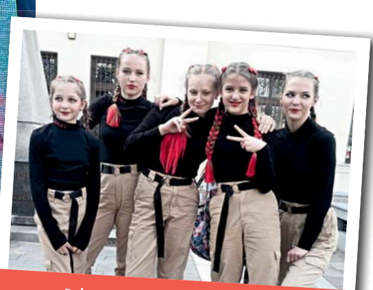
Dziewczęta z „Junior Wena Squad” - drugie miejsce w Wieliczce i Tarnowie