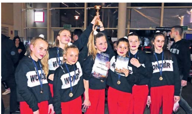
Wena Teens - dwukrotnie z pucharem za zwycięstwo w Wieliczce i Tarnowie

Junior” na obu imprezach tanecznych zdobyła drugie miejsce w formacjach średniozaawansowanych.