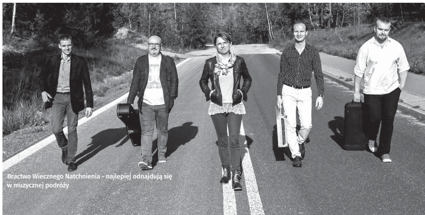
Bractwo Wiecznego Natchnienia - najlepiej odnajdują się w muzycznej podróży