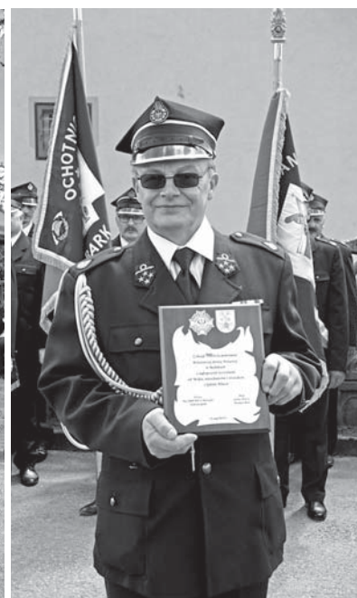
Gminny Dzień Strażaka był okazją do przekazania samochodu ratowniczo-gaśniczego jednostce OSP Ryczówek, a także do złożenia gratulacji z okazji jubileuszu 90-lecia powstania OSP w Rodakach