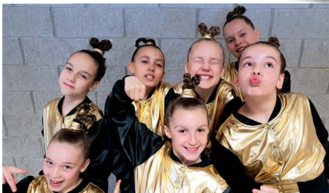
Roześmiane „Snaxy”, zdobywczynie trzeciego miejsca mistrzostw krajowych, półfinalistki z Rimini