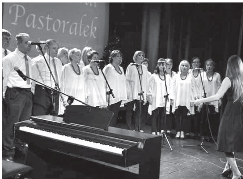
Zdobywcy drugiego miejsca - Rodaczanie

zdołali drugie miejsce! To duży sukces, bowiem w przesłuchaniach festiwalowych uczestniczyło 150 podmiotów wykonawczych. Wręczenie nagród laureatom festiwalu odbyło się 12 stycznia podczas koncertu galowego. ■