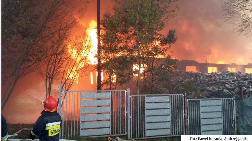
Fot.: Paweł Kotania, Andrzej Janik