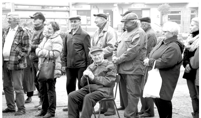
Mieszkańcy Klucz na uroczystości odstonięcia obelisku. Więcej zdjęć w galerii internetowej na www.gmina-klucze.pl