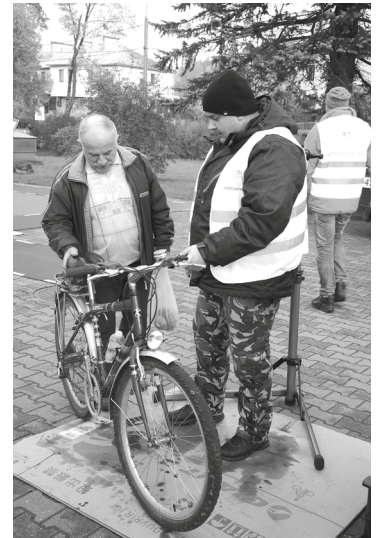
Akcja była okazją do bezpłatnego przeglądu roweru