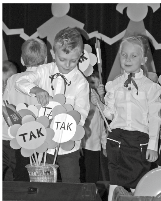
(RAJ) Program artystyczny w Szkole Podstawowej w Kluczach z okazji ślubowania klasy pierwszej.

Prawdopodobnie od przyszłego roku szkolnego nie będzie już naboru do klas pierwszych gimnazjów, jeśli zostanie wdrożona reforma oświatowa i związana z nią likwidacja gimnazjów. Uczniowie opuszczający klasę szóstą szkoły podstawowej, będą kontynuować naukę w siódmej, a potem w ósmej klasie SP.