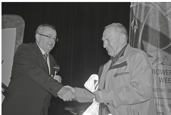
Gratulacje wylosowanemu laureatowi quizu składał Minister Infrastruktury Andrzej Adamczyk (na zdjęciu ze Stanisławem Kijasem, który zdobył II nagrodę)

prowadzona cyklicznie. Myślę, że pozwoli im uświadomić sobie, jakie zagrożenia wynikają chociażby ze zmienionych przepisów o ruchu drogowym, o czym nie wszyscy seniorzy być może wiedzą – powiedział Andrzej Adamczyk. Powiedział także, iż sama akcja ma nie tylko wymiar edukacyjny. Oprócz sprawdzenia swojej wiedzy i umiejętności, uczestnicy ruchu drogowego mogli także przejść bezpłatne badania, na przykład wzroku, co jest niezmiernie ważne dla użytkowników wszelkich pojazdów. W gminie Klucze badania takie były zaplanowane w niedzielę w Chechle.