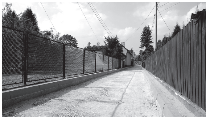
Ulica Poprzeczna w Kwaśniowie Dolnym w trakcie przebudowy

Trwa przebudowa ulicy Poprzecznej w Kwaśniowie Dolnym. Koszt inwestycji wyniesie 67 000zł. Droga zostanie pokryta nawierzchnią z kostki.