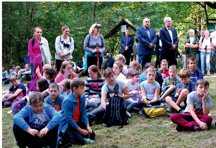
Uroczyste zakończenie Rajdu Hardego na polanie w Górach Bydlińskich.