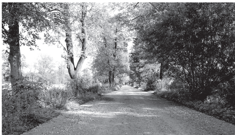
Utwardzona droga w Kluczach - Osadzie przy stawie Pilny. Uwaga! Na tej drodze obowiązuje ograniczenie nośności pojazdów do 5 ton oraz ograniczenie prędkości (progi zwalniające).

Odnowiona nawierzchnia tłuczniowa pojawiła się na odcinku od drogi wojewódzkiej do stawu w Kluczach-Osady, popularnego miejsca rekreacyjnego (obecnie w użytkowaniu Stowarzyszenia Turystyczno-Wędkarskiego „Biała Przemsza”). Naprawa obejmowała odcinek o długości 370 m. Nawierzchnię odnowiono również w Kluczach na odnodze ul. Olkuskiej (za cmentarzem), na odcinku 280 metrów.