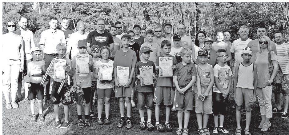
Stowarzyszenie organizuje kilka razy w roku zawody wędkarskie, także dla dzieci.

W 2015 roku została założona Szkołka Wędkarska dla dzieci i młodzieży z terenu Gminy Klucze w dwóch grupach wiekowych. Szkolenie z dziećmi i młodzieżą prowadzi (w ramach wolontariatu) doświadczony wędkarz. Od lat Stowarzyszenie organizuje zawody dla dzieci z terenu Gminy Klucze z okazji Dnia Dziecka oraz zawody pn.: „Wiosna”, „Mistrz STW”, „Puchar Wójta Gminy Klucze”, „Jesień”, a także turnieje z nagrodami i poczęstunkiem pn.: „Lato” oraz „Jesień” dla dzieci Szkołki Wędkarskiej.