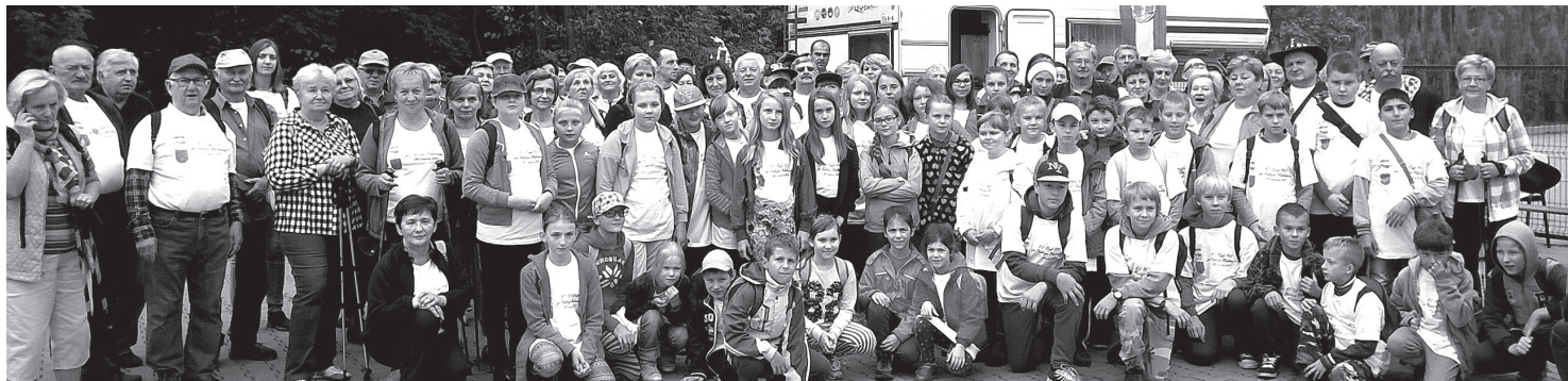
Sporym zainteresowaniem cieszą się organizowane przez Koło PTTK rajdy po Pustyni Błędowskiej