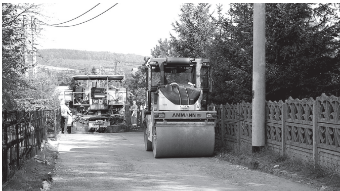
Nawierzchnia drogi w Ryczówku podczas przygotowań do położenia asfaltu

Zakończyły się prace związane z budową drogi asfaltowej z Ryczówka na Godawicę (przedłużenie ulicy Dolnej w Ryczówku). Prace zostały sfinansowane z budżetu Gminy Klucze (w tym z funduszu sołectkiego).