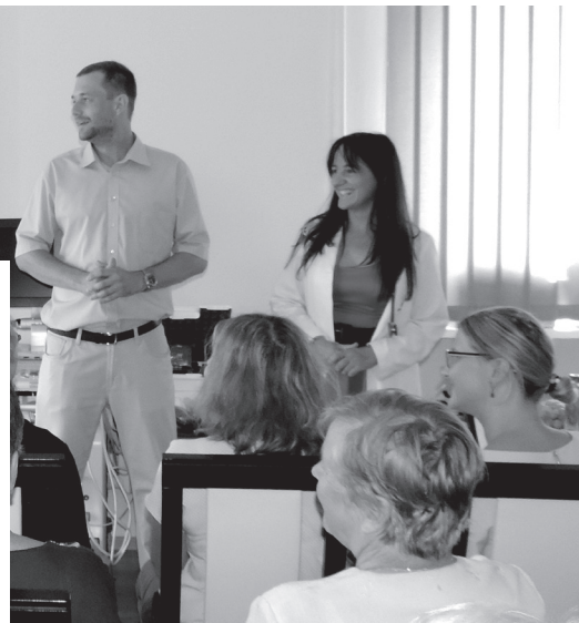
Spotkanie z mieszkańcami z okazji otwarcia gabinetu kardiologicznego