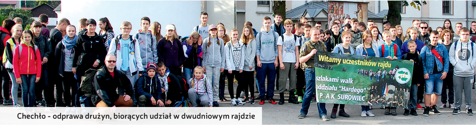
Chechło - odprawa drużyn, biorących udział w dwudniowym rajdzie

Witamy uczestników rajdu szlakami walk oddziału "Hardego" P. A. K. SUROWIEC