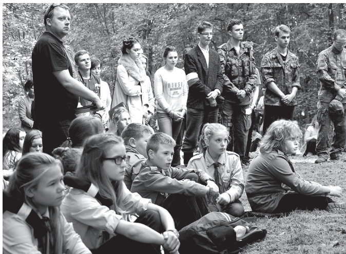
Młodzież i opiekunowie na zakończeniu Rajdu Hardego - harcerze z Jarosławca i licealiści z „Baczyńskiego” w Olkuszu