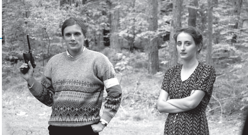
Na drużyny przybywające do Borów Kwaśniowskich czekała z zadaniami młodzież z Klubu Historycznego im. AK z Olkusza