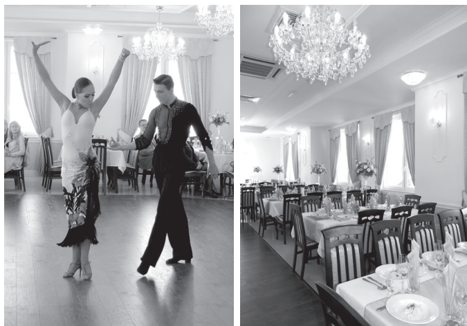
Otwarcie domu weselnego towarzyszył pokaz taneczny w wykonaniu zawodowych tancerzy.