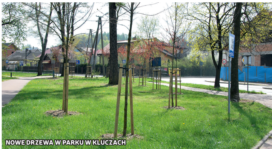
NOWE DRZEWA W PARKU W KLUCZACH