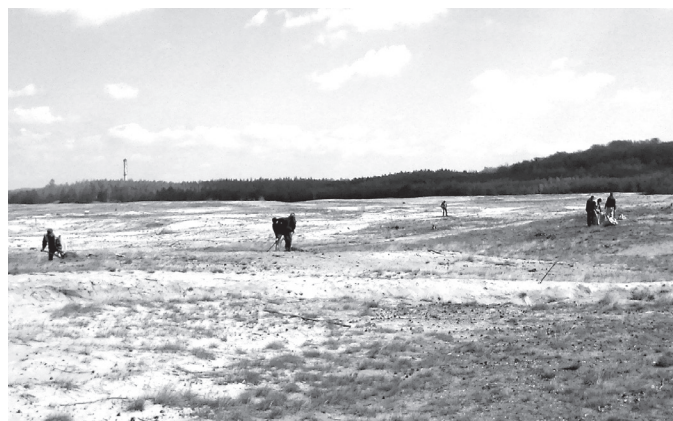
Osadzeni porządkowali m.in. teren Pustyni Błędowskiej.

To na razie akcja jednorazowa, ale jak mówi Wójt Gminy Klucze Norbert Bień, jest szansa na podpisanie porozumienia, na mocy którego osadzeni mogliby okresowo wykonywać prace społecznie użyteczne (porządkowe, remontowe) na terenie Gminy Klucze.