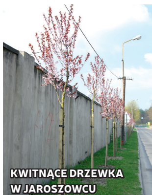
KWITNĄCE DRZEWKA W JAROSZOWCU