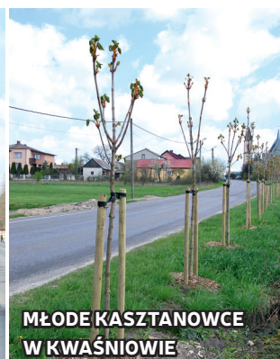
MŁODE KASZTANOWCE W KWAŚNIOWIE