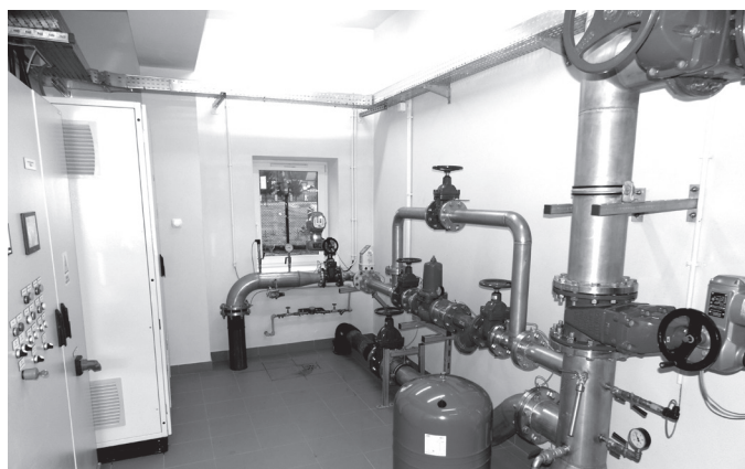
Nowe ujęcie wody - pomieszczenie technologiczne