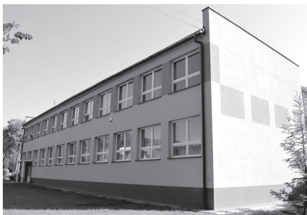
Plan zakłada także zwiększenie inwestycji w zakresie termomodernizacji budynków użyteczności publicznej. Na zdjęciu: budynek Szkoły Podstawowej w Jaroszowcu po termomodernizacji w 2013 roku.