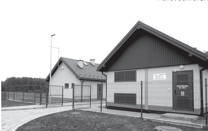
Nowe ujęcie wód głębinowych, budynek technologiczny i stacja energetyczna w Cieślinie