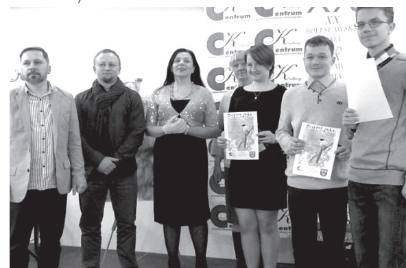
Laureaci w kat. szkół podstawowych (zdjęcie górne) oraz nagrodzeni gimnazjaliści z organizatorami i jurorem konkursu (zdjęcie dolne).