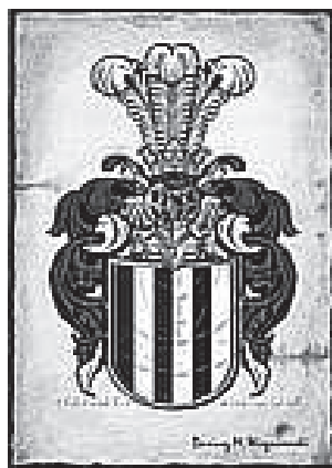
Herb rodziny Wolickich