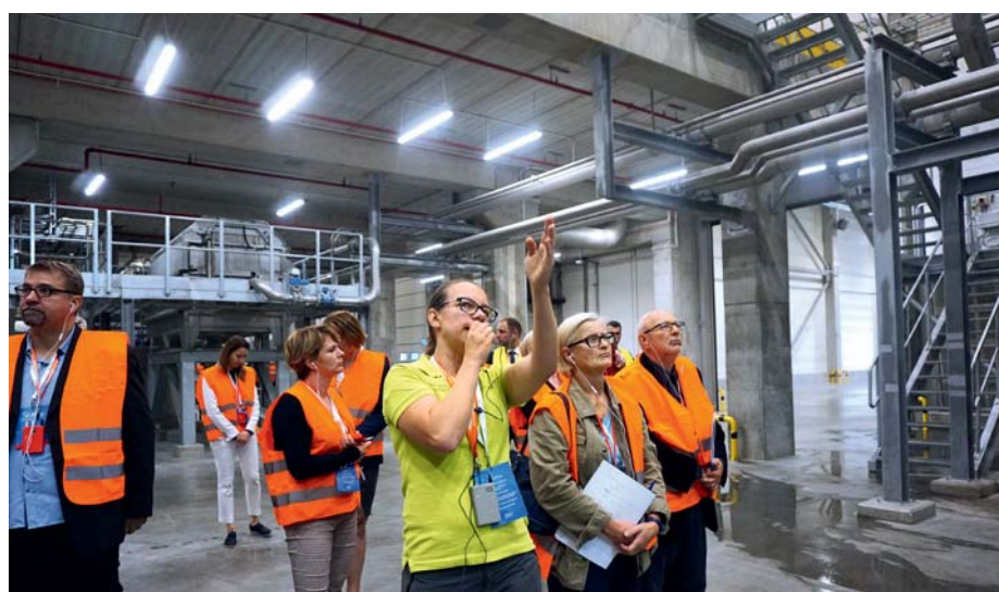
Jubileusz był okazją do zwiedzenia zakładu – najnowszych linii produkcyjnych i pomieszczeń.