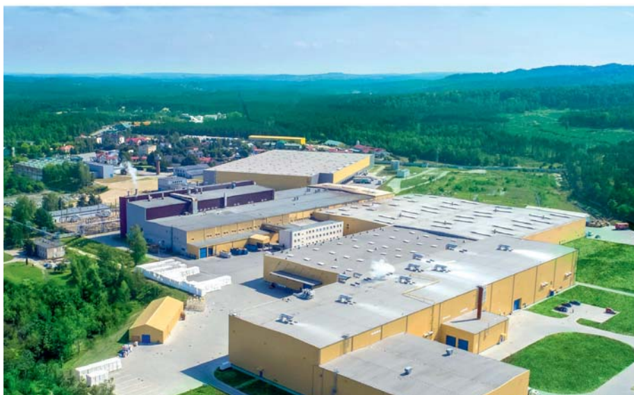
Rozbudowany zakład w Kluczach ma łączną powierzchnię 63 tys. m kw.

osób, a rozbudowany zakład (o łącznej powierzchni 63 tys. metrów kwadratowych!) dysponuje 12 liniami przetwórczymi i 2 magazynami. Najnowszy z nich (o pow. 21 000 m kw.) mieści ponad 38 000 palet i umożliwia załadunek i rozładunek na 16 stanowiskach. To prawdziwe centrum dystrybucyjne, obsługujące klientów w Polsce i w 18 krajach świata. Z kolei produkcja bibułki higienicznej odbywa się na dwóch maszynach papierniczych, z których ta najnowsza uruchomiona została w marcu tego roku.