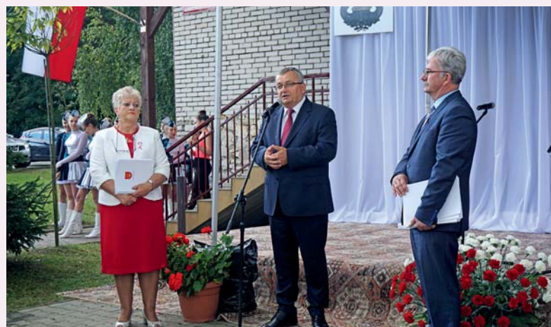
Gościem piątego pikniku JURA 1914 był minister infrastruktury Andrzej Adamczyk. Na zdjęciu z sőtys Aliną Kuśmierską i wójtem Norbertem Bieniem.