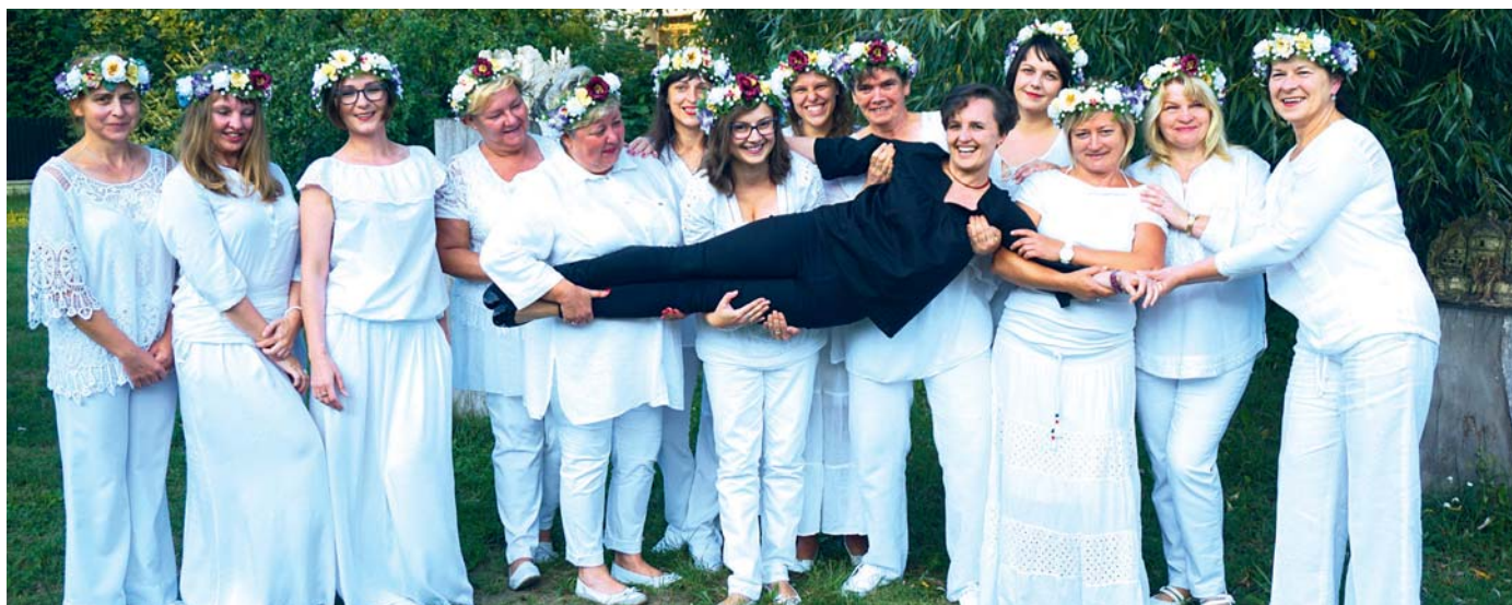
„Enigmę” tworzy szczęśliwa trzynastka pań. Panowie, może ktoś z wokalistów dołączy do chóru?