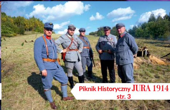
Piknik Historyczny JURA 1914 str. 3

Podsumowanie inwestycji zrealizowanych w kadencji 2014-2018 str. 11