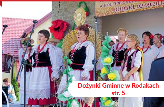
Dożynki Gminne w Rodakach str. 5