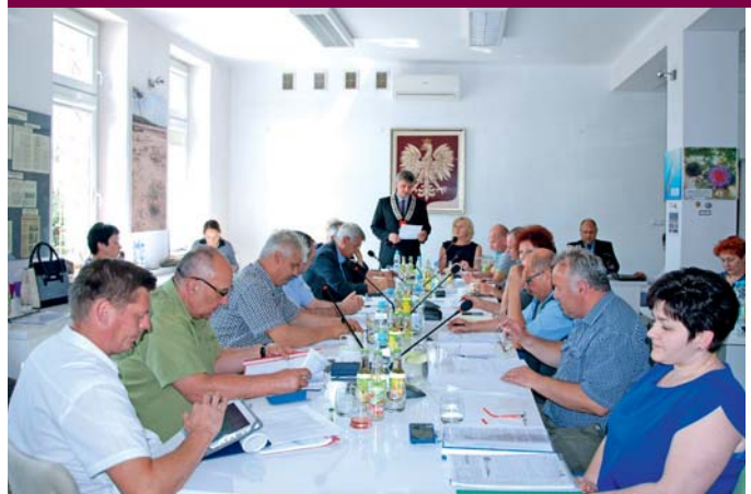
Sesja Rady Gminy Klucze kadencji 2014-2018